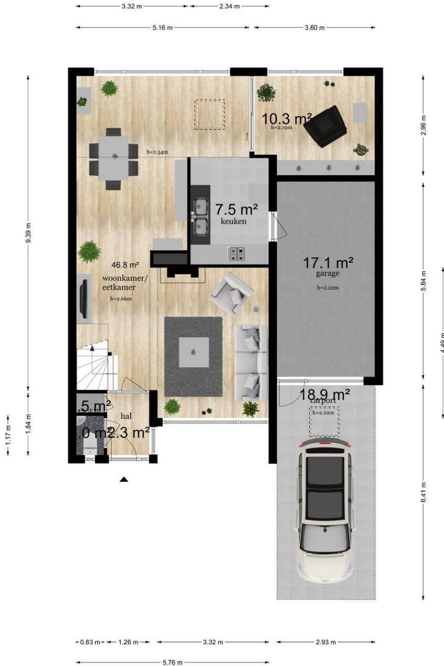
Vijverlaan 26, Leersum Begane Grond

De plattegronden zijn geproduceerd voor promotionele doeleinden en ter indicatie. Aan de plattegronden kunnen geen rechten worden ontleend © www.objectenco.nl